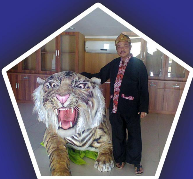
Kepala Desa Cimaung

Profil Desa Tahun 2019 adalah publikasi penyusunan potensi dan perkembangan desa/kelurahan diterbitkan oleh pemerintahan desa/kelurahan yang menyajikan data potensi dan perkembangan desa secara lengkap. Data yang ditampilkan diantaranya adalah data potensi sumber daya alam dan manusia, potensi perkembangan potensi sarana dan prasarana, perkembangan penduduk, masyarakat produk domestik desa/kelurahan bruto, pendapatan perkapita, struktur mata pencaharian, aset ekonomi masyarakat, pendidikan masyarakat, kesehatan masyarakat, keamanan dan ketertiban, kedaulatan politik, lembaga kemasyarakatan dan pemerintahan desa/kelurahan. Profil Desa ini jauh dari sempurna tetapi diharapkan menjadi sumber data di tingkat desa.