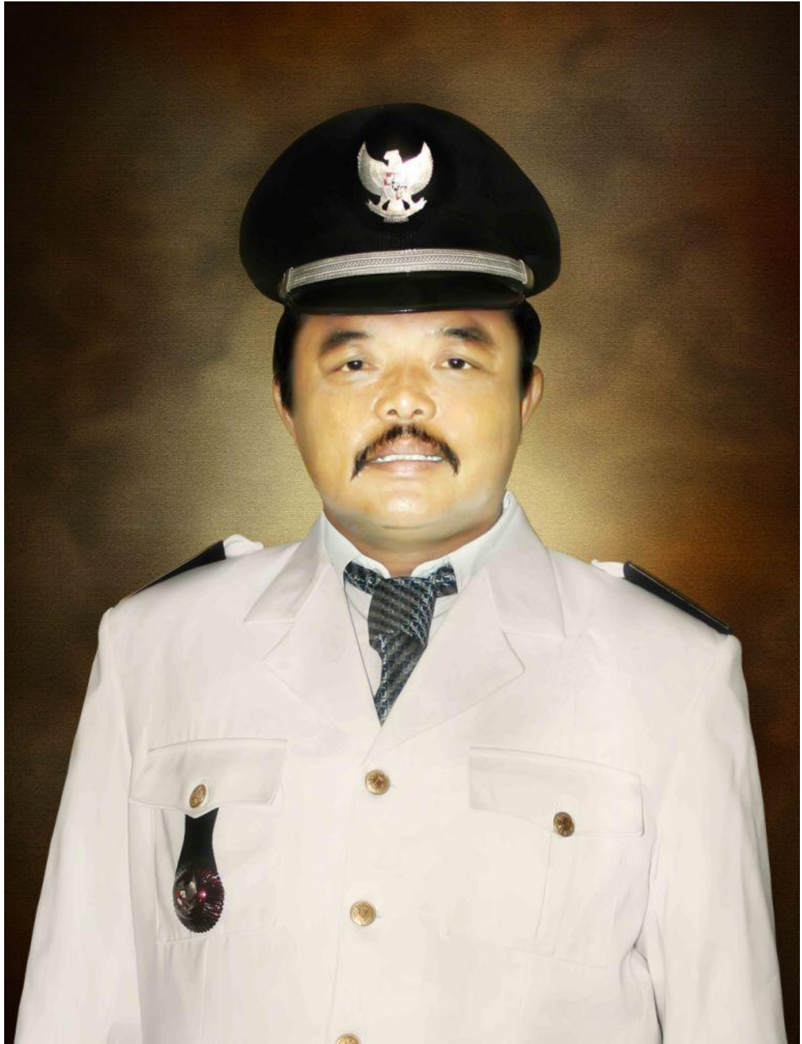
KOMARA KEPALA DESA CIMAUNG